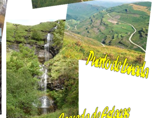
Puerto de Lunada