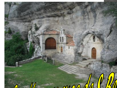
Ermita y cuevas de S. Bernabé