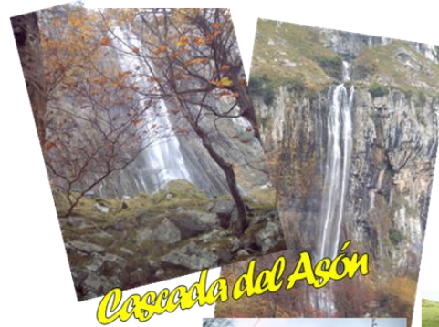
Cascada del Asón