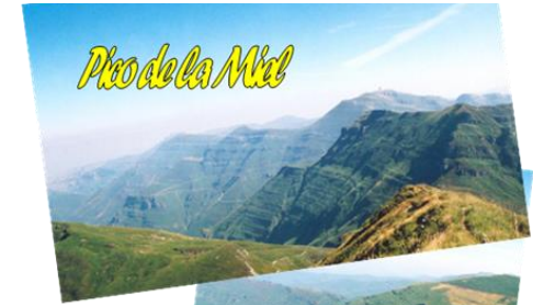
Pico de la Miel